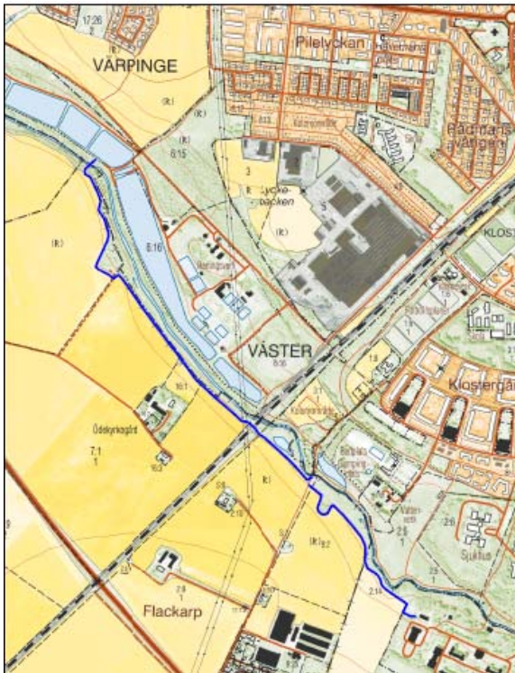
Karta över nyanlagd stig vid Flackarp.