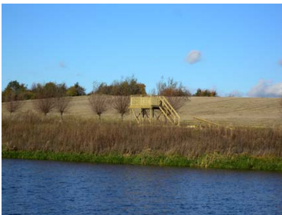
Fågeltorn vid Källby