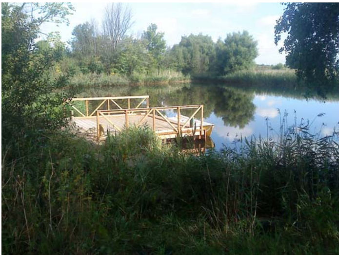
Brygga vid Habo dammar (2)

Karta över stigar samt sifferbeteckning som representerar olika åtgärder som utförts vid dammarna, såsom utsiktsplattform (3), brygga (2), rastplats (1) och parkering (9).