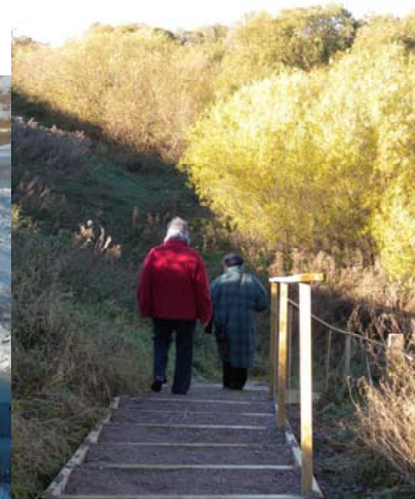
Nyanlagd bro över Höje å samt trappa ner till bron från södra sidan vid Källby, Lund.