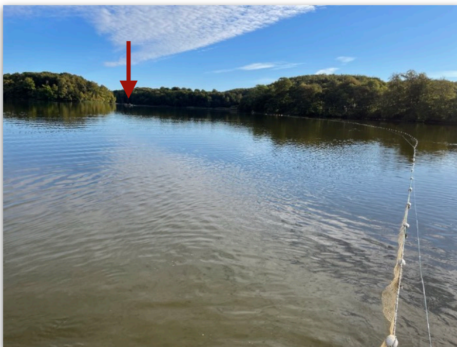
Figur 2. Notfiske i Häckebergasjön hösten 2022. Den 340 meter långa noten läggs ut med hjälp av båt och flottar och ett område på ca 4 hektar fiskas av. Fisken hamnar till sist i notsäckerna som är placerad i mitten av noten där fisken ligger kvar i vattnet tills den håvas upp. Pilar visar var andra änden på noten är.