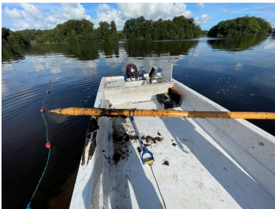
Figur 4. I första notdraget fastnade noten i en stor stolpe/påle som var nedtryckt i botten. Liknande stolpar brukar användas av yrkesfiskare vid uppsättning av bottengarn, och kan ha missats att tas bort då den inte stack upp över ytan. Noten drogs rejält sönder och förmiddagen gick till att laga nät.