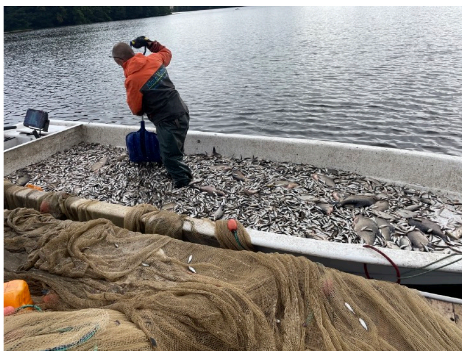
Figur 5. Representativ fångst 2023 med stor andel mindre mört i fångst.