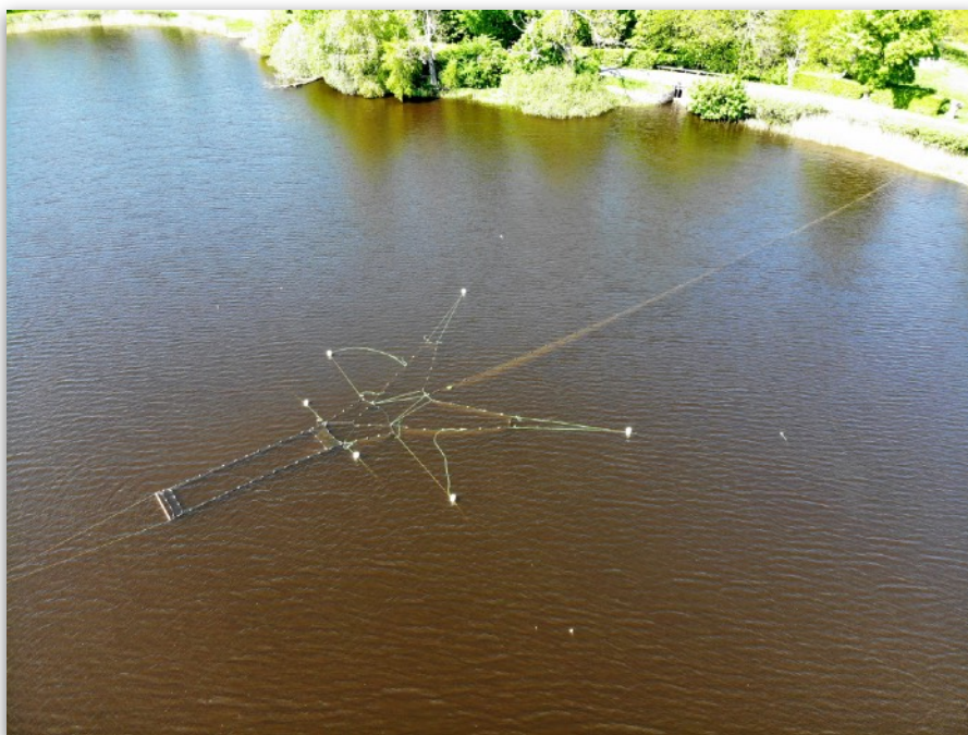
Figur 1. Bottengarn i Häckebergasjön våren 2018. Från land går en landarm som hindrar fisken från att simma förbi. Landarmen leder in fisken i fångstanordningen där fiskhuset i detta fall är uppbyggd som en öppen box.